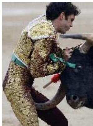
El torero José Tomás, grave tras ser operado en la enfermería de Las Ventas