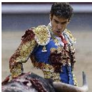
El torero José Tomás, grave tras ser operado en la enfermería de Las Ventas