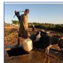
El PAM : de cuatr contra e